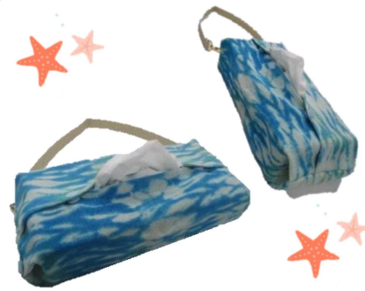
タテでもヨコでも使えるよ♪