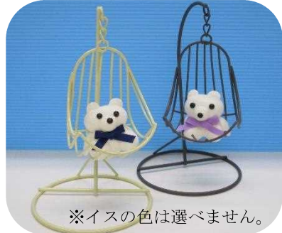
※イスの色は選べません。