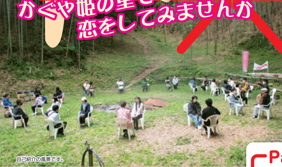
自己紹介の風景です。