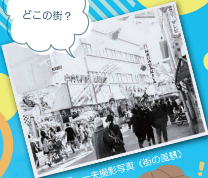
平田松平・一夫撮影写真《街の風景》