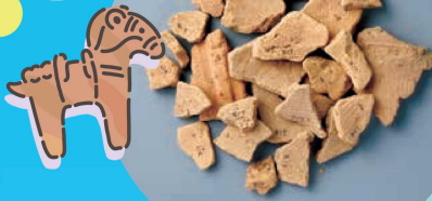
高崎市不動山古墳出土 《円筒埴輪片》