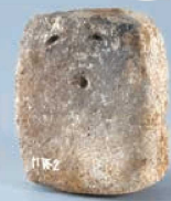
前橋市西新井遺跡出土 《土版》