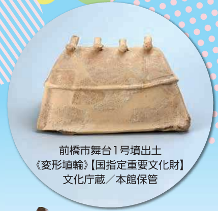
前橋市舞台1号墳出土 《変形埴輪》【国指定重要文化財】 文化庁蔵／本館保管

最近、埴輪がブームになっています。刀剣のブームも続いているようです。でもマニア以外の方にとって、埴輪や刀剣の情報がもう少しあれば、展示資料をさらに一歩踏み込んで見ることがや楽しむことができます。本展は今まで興味がなかった時代、または素通りしていた展示コーナーなどに、少しでも興味や関心を持っていただこうと企画しました。展示資料についての素朴な疑問を想定し、目からウロコの見かたを紹介します。ただ観覧するのではなく、自分なりの疑問や好奇心をもって博物館資料を見ていただき、その楽しさをお伝えできればと思っています。またブームに乗って、本館が収蔵する貴重な埴輪も展示します。どうぞお楽しみください。