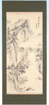
金井烏洲《水亭避暑》